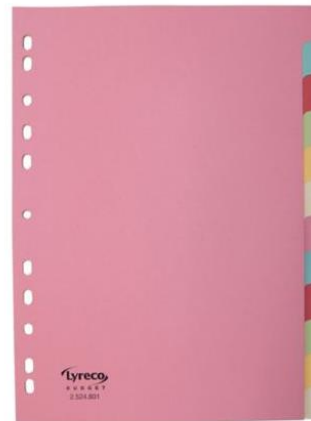
Une série de 12 intercalaires en carton