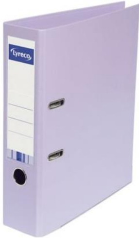
Un classeur à levier A4 dos 4cm de couleur lilas